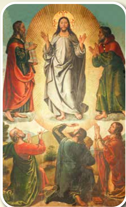
Foto: transfiguração de Jesus

Ó Deus, que na gloriosa Transfiguração de vosso Filho confirmastes os mistérios da fé pelo testemunho de Moisés e Elias, e manifestastes de modo admirável a nossa glória de filhos adotivos, concedei aos vossos servos e servas ouvir a voz do vosso Filho amado, e compartilhar da sua herança.